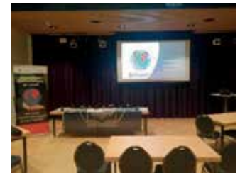
Handhaving & Toezicht