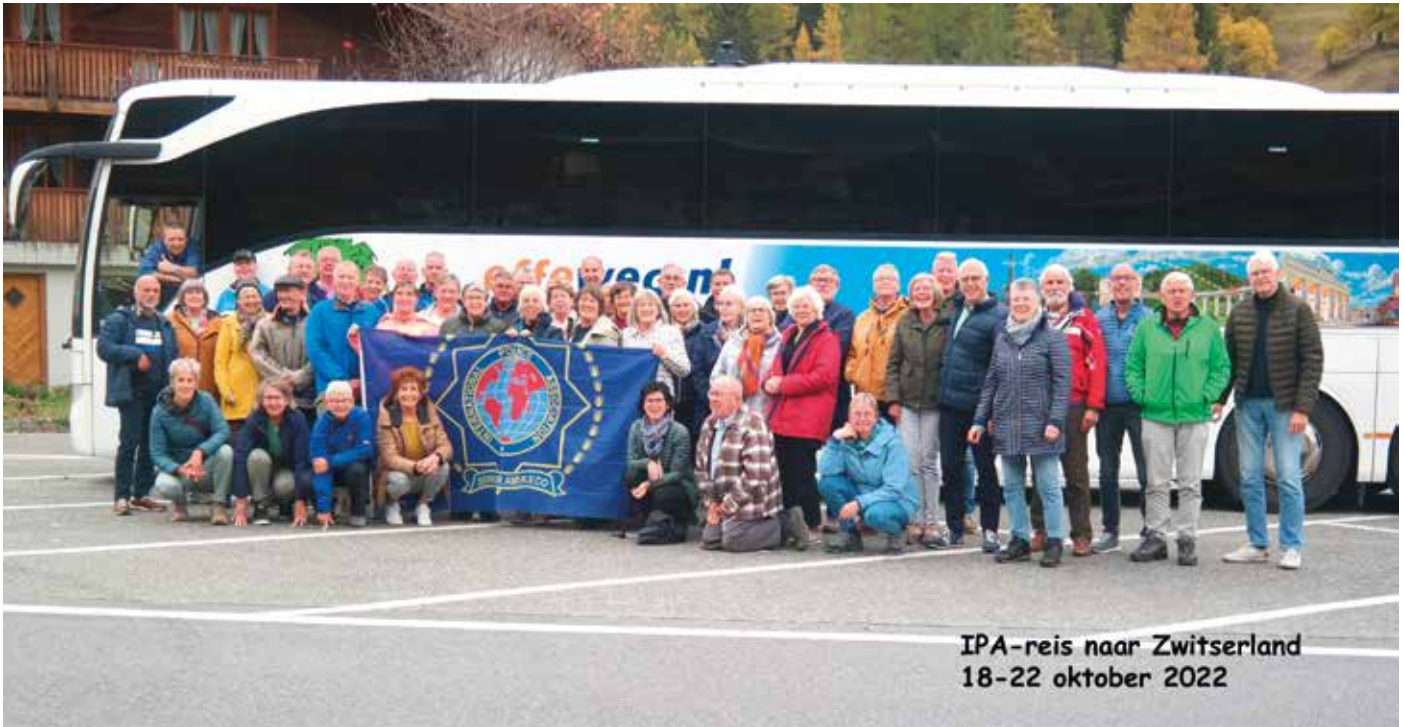
IPA-reis naar Zwitserland 18-22 oktober 2022