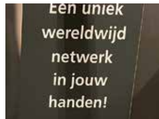
Douane / KMar brigades